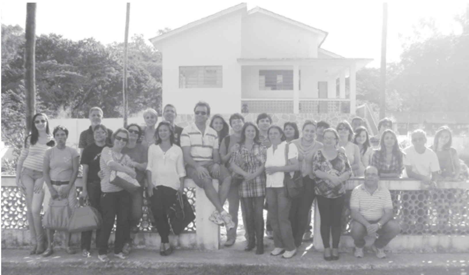
Colaboradores posam em frente à casa da Fazenda Modelo, no momento em que uma garça sobrevoa o espaço